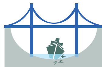
Wasserstand ist unter einem bestimmten Niveau