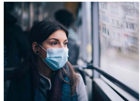
La crisis pandémica de COVID-19 está limitando los recursos para prepararse ante tormentas severas y huracanes